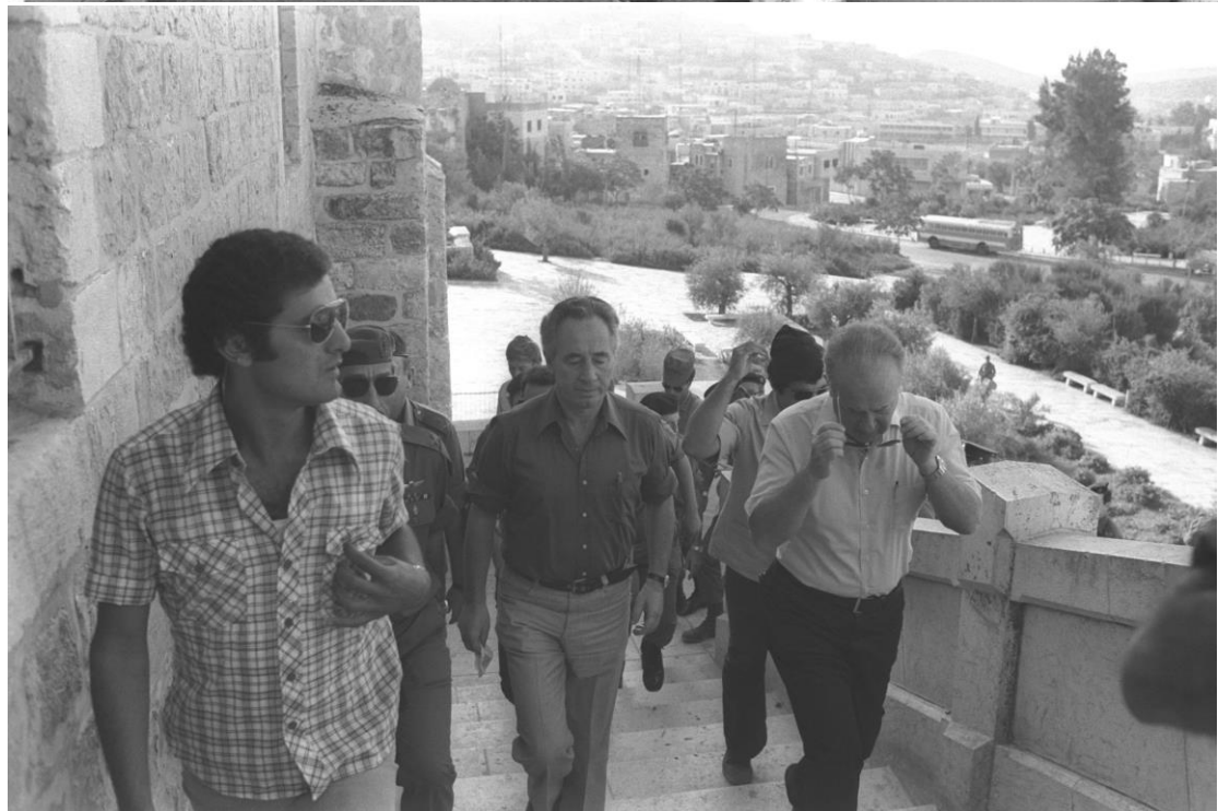
רה"מ יצחק רבין ושהב"ט שמעון פרס בביקור במערת המכפלה בעקבות פרעות של פלסטינים, שכללו השחתת ספרי תורה, אוקטובר 1976