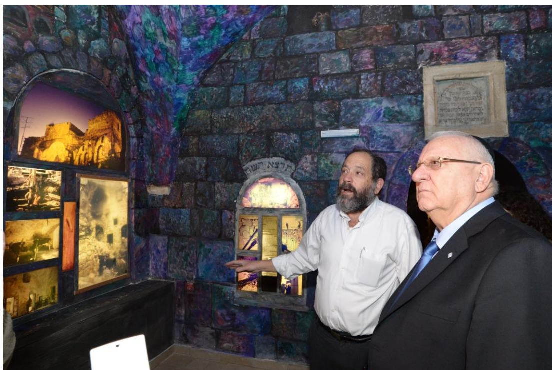
הנשיא ריבלין בביקור בחברון, פברואר 2015