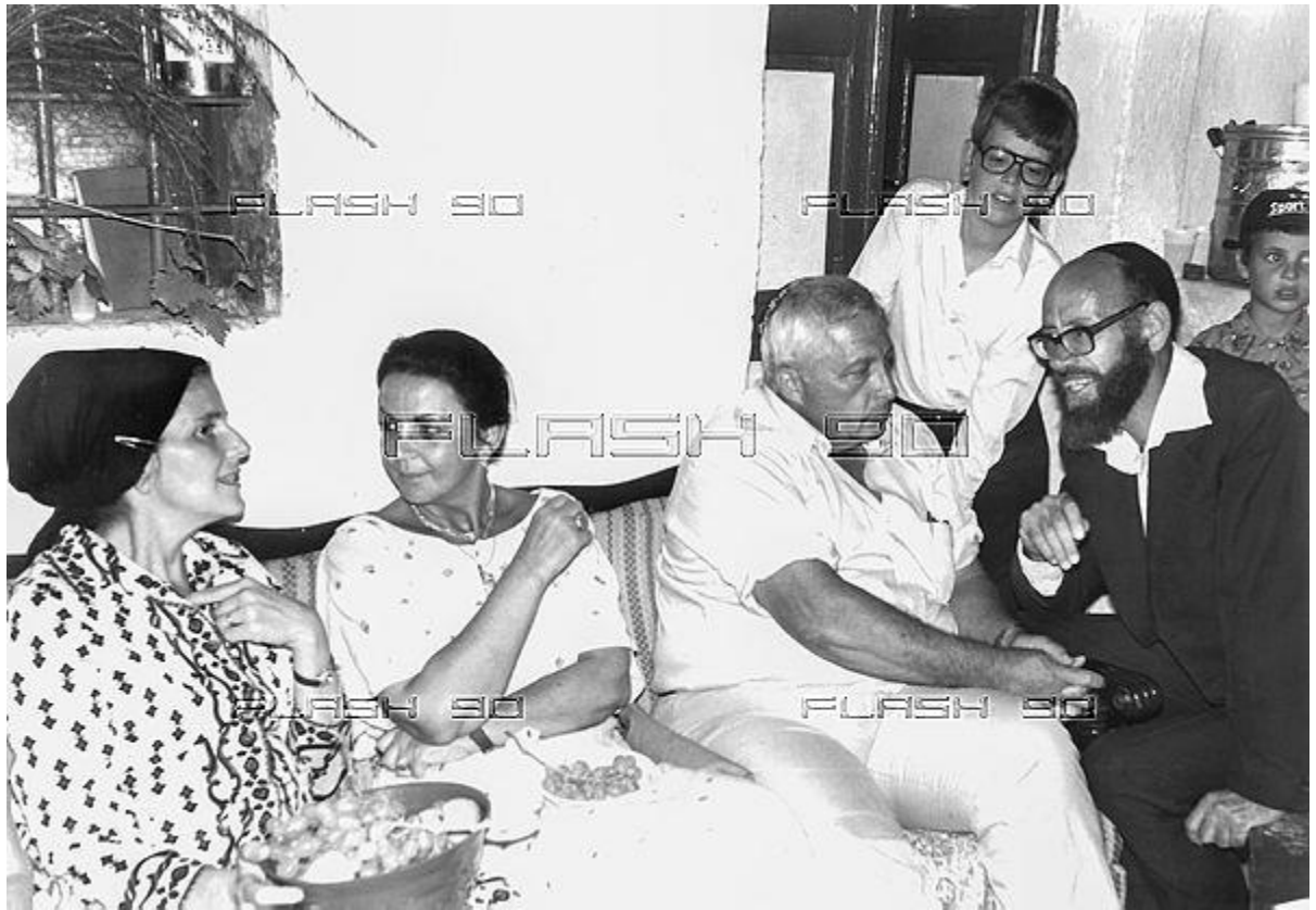
אריאל שרון ורעייתו לילי במתחם הדסה בחברון, תאריך לא ידוע