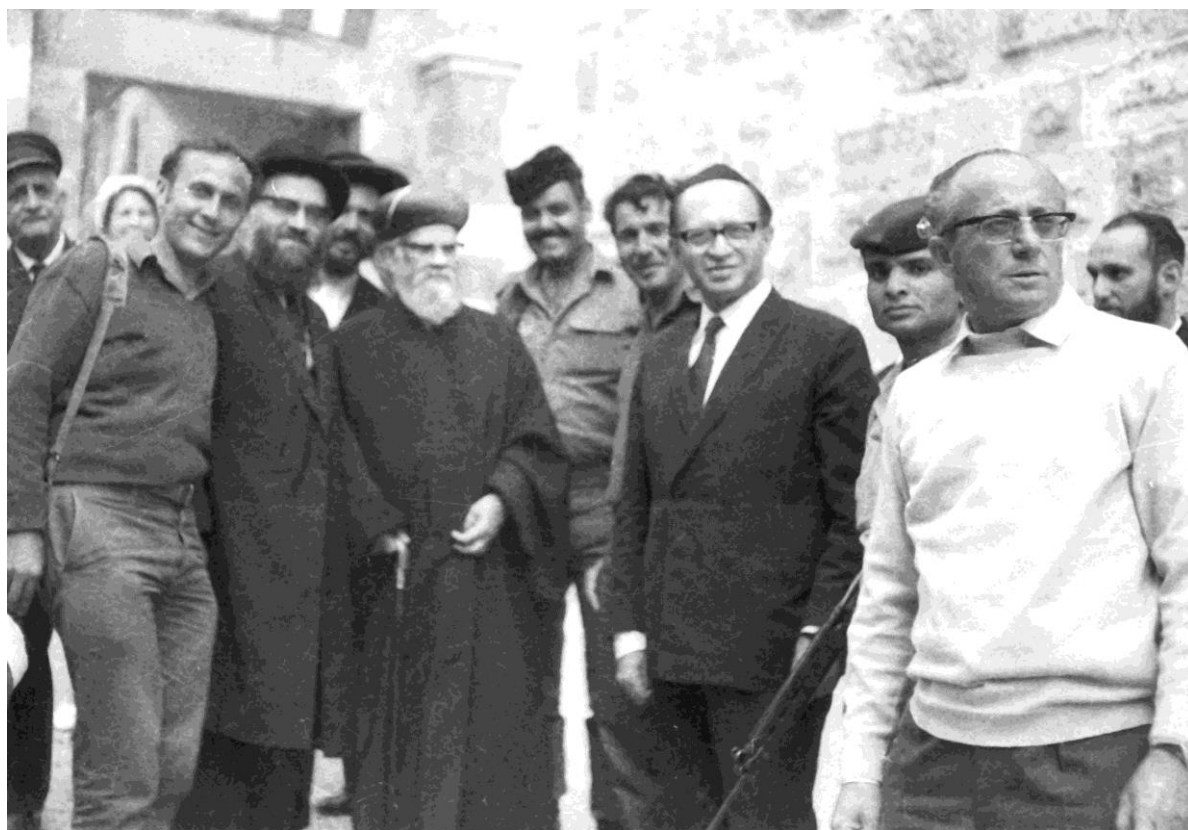
השר מנחם בגין בביקור בחברון עם הרב הראשי יצחק ניסים, 25 במאי 1970