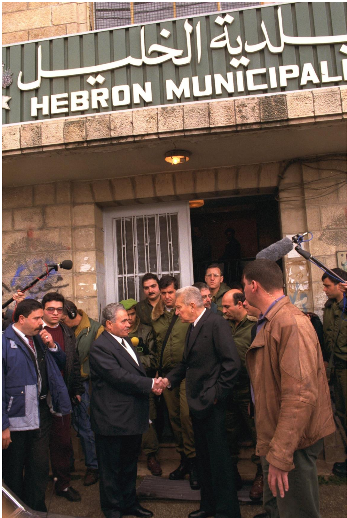
הנשיא עזר ויצמן בביקור אבלים בעיריית חברון בעקבות הטבח במערת המכפלה, פברואר 1994