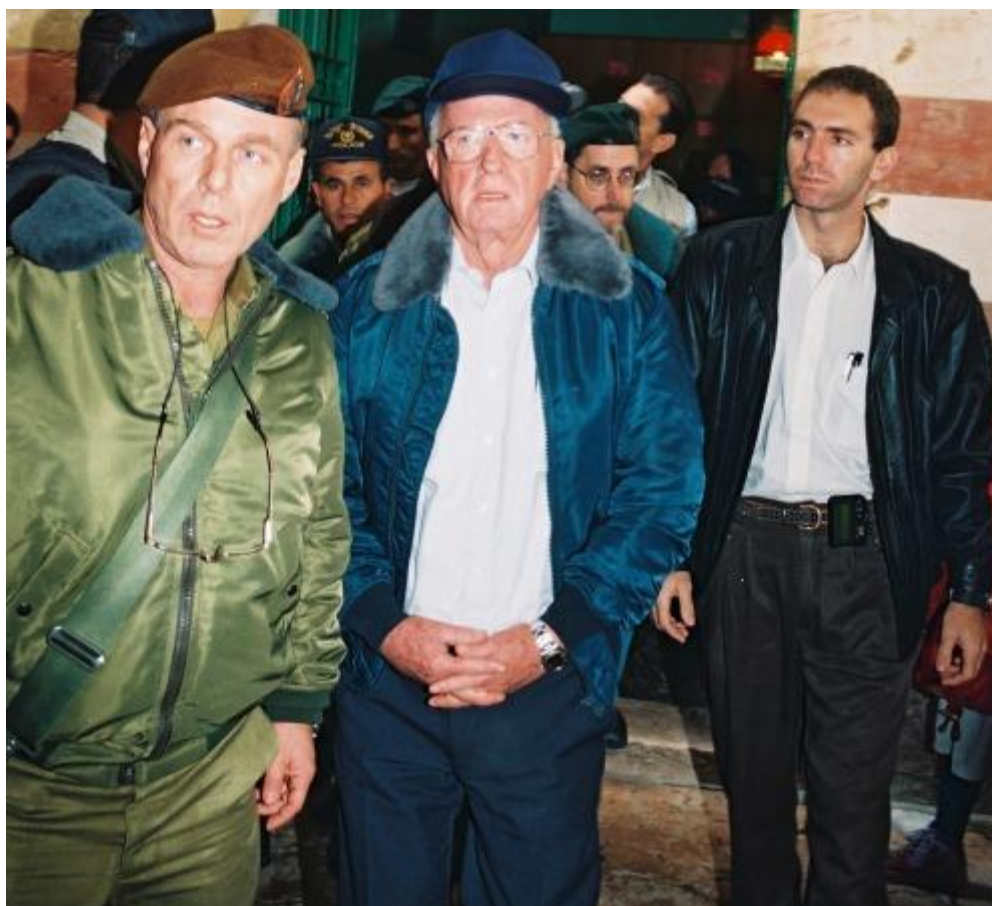
רה"מ רבין בביקור במערת המכפלה, נובמבר 1994