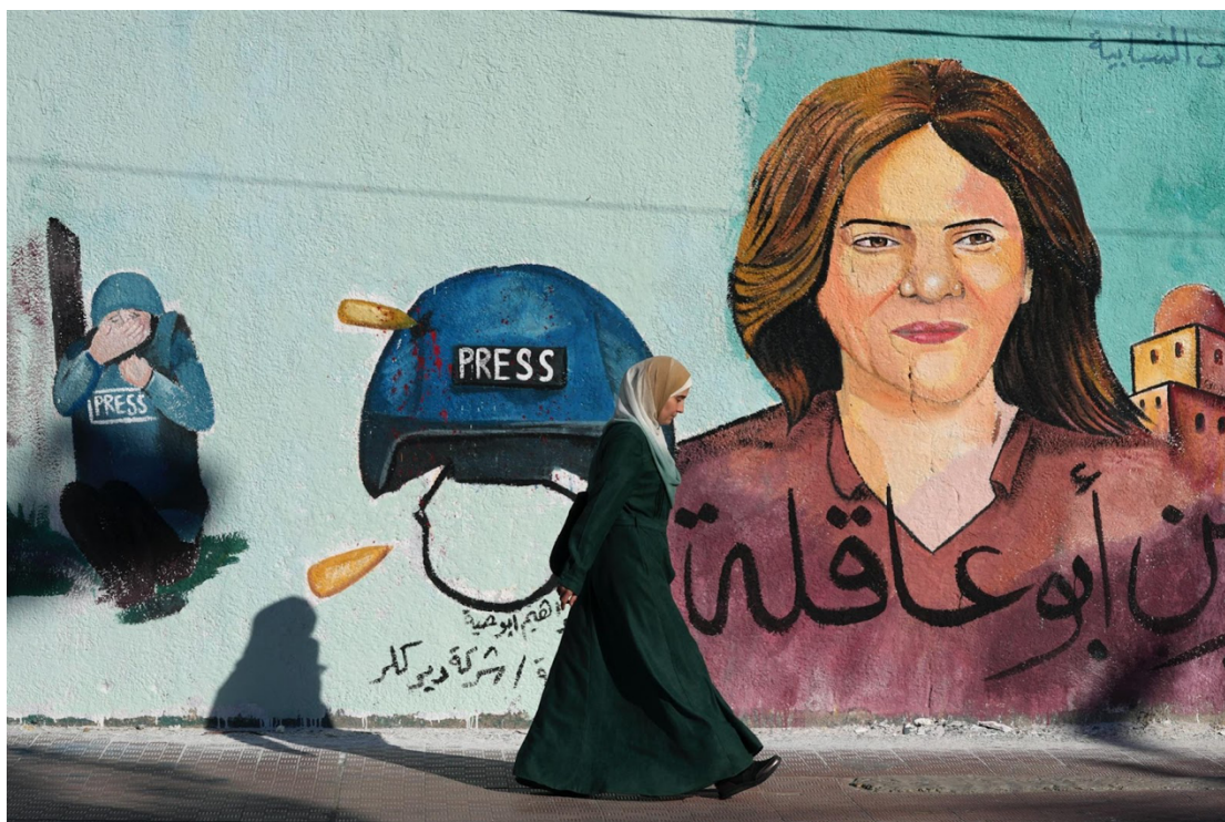
ציור קיר של כתבת אל-ג'זירה בערבית, העיתונאית שירין אבו עאקלה, שנהרגה על ידי חייל ישראלי בעיר ג'נין בגדה המערבית. הציור נראה בקיר בעיר עזה ב-15 במאי 2022.