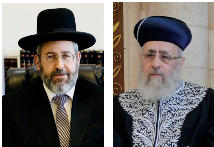
הרבנים המכהנים: הראשלי"צ הרב דוד יוסף והרב דוד לאו

למותר לציין שמלבד הפגם המוסרי והמנהלי בתקנות הללו המוסרות את הרבנות בידי פוליטיקאים ומעודדות את תרבות הג'זבים וסידור העבודה למקורבים, התקנות מנוגדות לאופן שבו מונו רבנים מאז ומעולם במסורת ישראל. "אין מעמידין פרנס על הצבור אלא אם כן נמלכים בצבור", קבע האמורא רבי יצחק במסכת ברכות (נה ע"א), במה שהפך לכלל מכונן במינוי רבנים לאורך הדורות. הרבנות תמיד צמחה "מלמטה" והייתה תלויה בהסכמת הקהילה. תקנות הרבנים, לעומת זאת, מבקשות "להנחית" רבנים מלמעלה, על ידי פוליטיקאים ונציגיהם,