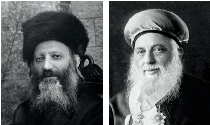
הראשל"צ הרב יעקב מאיר והרב אברהם יצחק הכהן קוק

ופוסק אחר, דוגמת הרב שלמה- זלמן אויערבך [זצ"ל], יעדיפו, כדבר שבשגרה, את פסקיה של הרבנות הראשית."