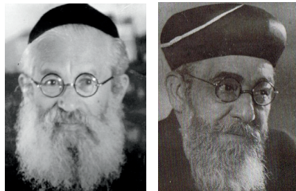
הראשל"צ הרב מאיר חי עוזיאל והרב יצחק הלוי הרצוג

לא למציאות הזו פילל הראי"ה קוק, מייסד הרבנות הראשית בשנת תרפ"ב. הרב קוק ביקש להשיב את כבוד הרבנות למקומו דרך בחירת רבנים גדולים ומובהקים, שסגולת אישיותם מעוררת הערצה וכבוד מצד כל העם. הוא הבין שלכבוד