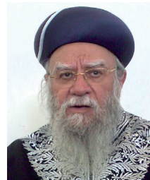
א"ח, הרב חיים טולמסקין: תולמסקין

הראש"צ הרב אליהו בקשי דרוון והרב ישראל מאיר לאו האחראית על ביצועו בפועל.