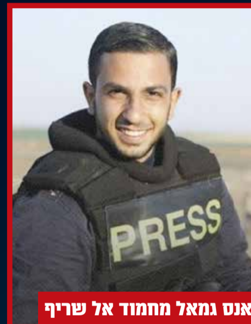
אנס גמאל מחמוד אל שריף